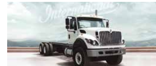
Foto de referencia Nota: las especificaciones y descripciones de este material son las más exactas al momento de la publicación. El fabricante se reserva el derecho de hacer cambios sin previo aviso. Cualquier inquietud comuníquese con su distribuidor local.